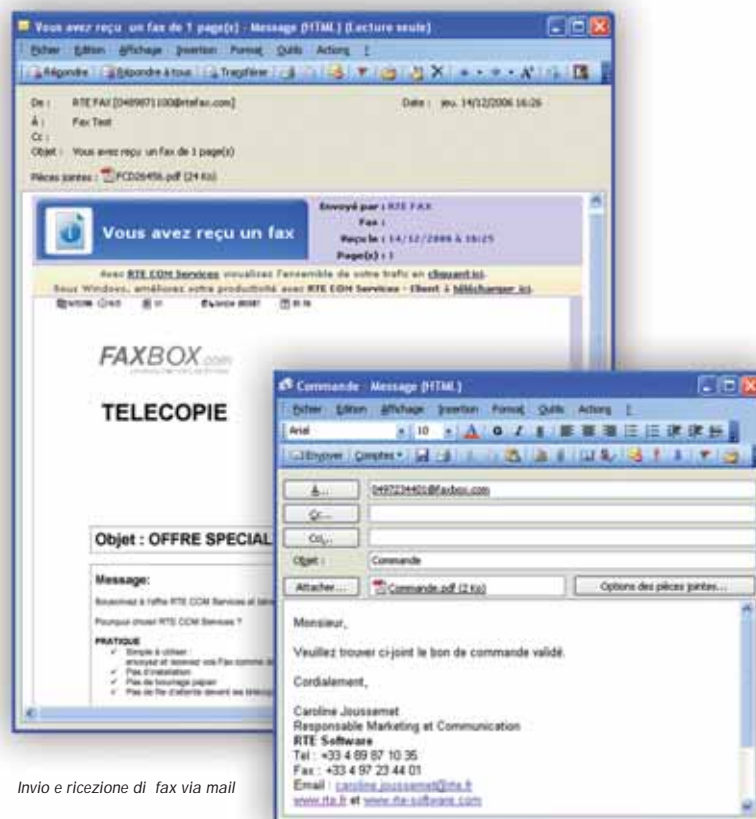
Invio e ricezione di fax via mail

Potete in ogni momento collegarvi al sito web www.faxbox.com e cliccare sull'etichetta SMS per accedere al servizio.